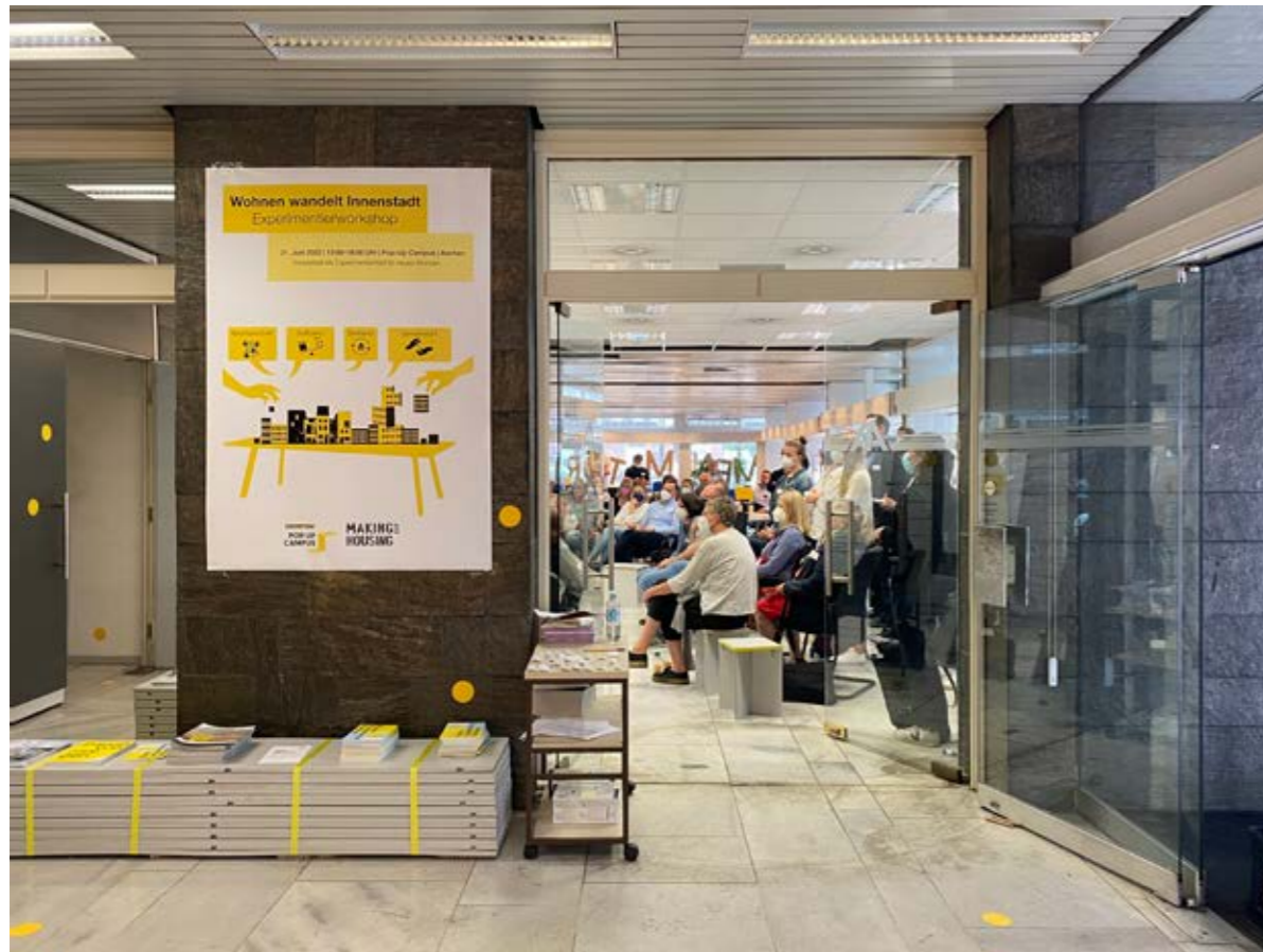
Veranstaltung „Making of Housing“