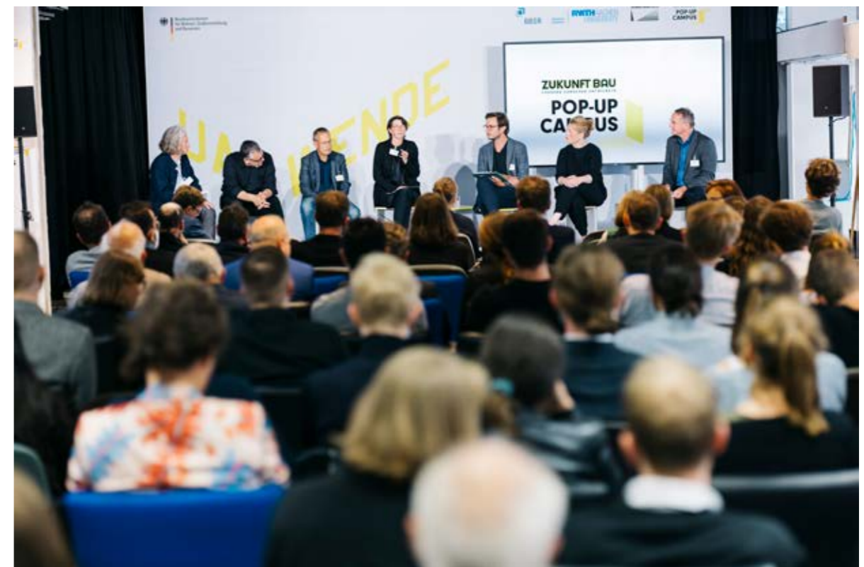
Eröffnung des Pop-up Campus