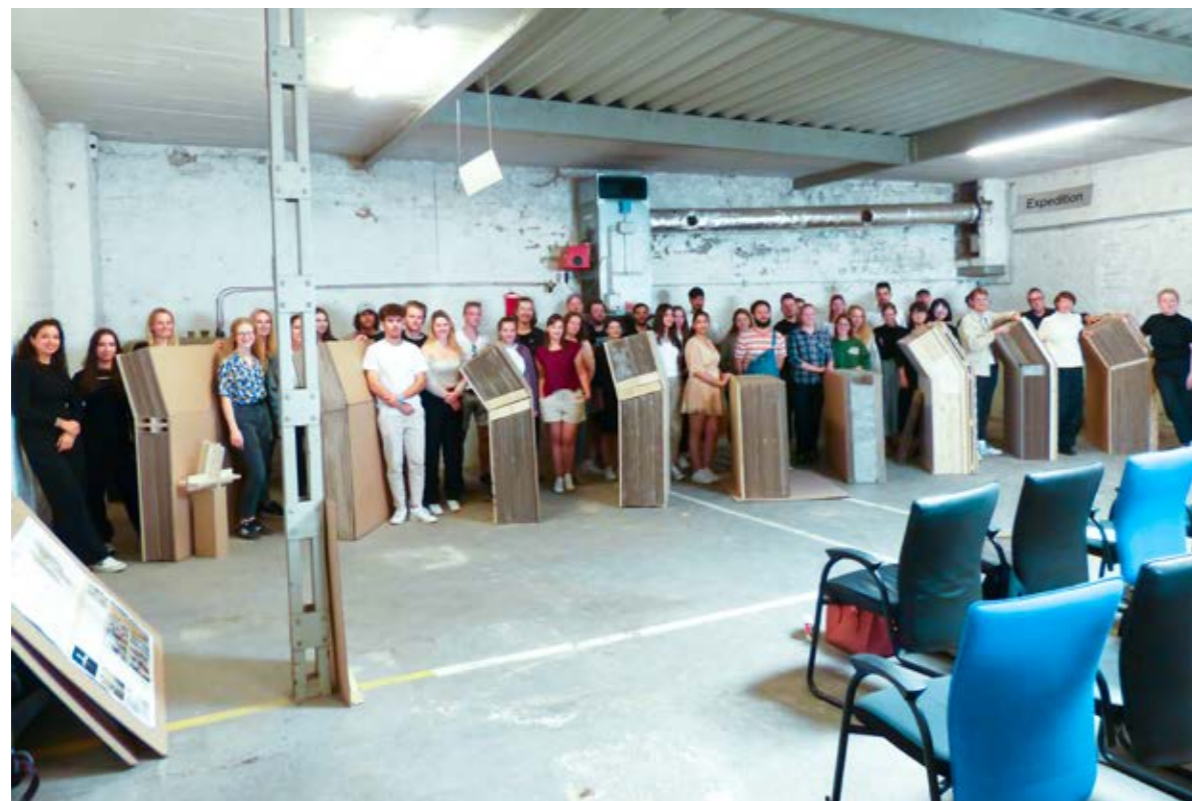
Workshop „Bauen mit Papier“