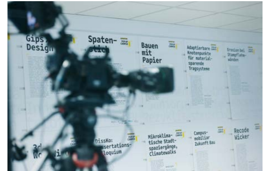
Eröffnung des Pop-up Campus