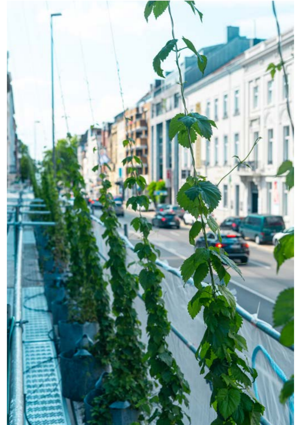
Fassadenbegrünung Pop-up Campus

RWTH Aachen University, Lehrstuhl für Gebäudetechnologie & Climateflux GmbH